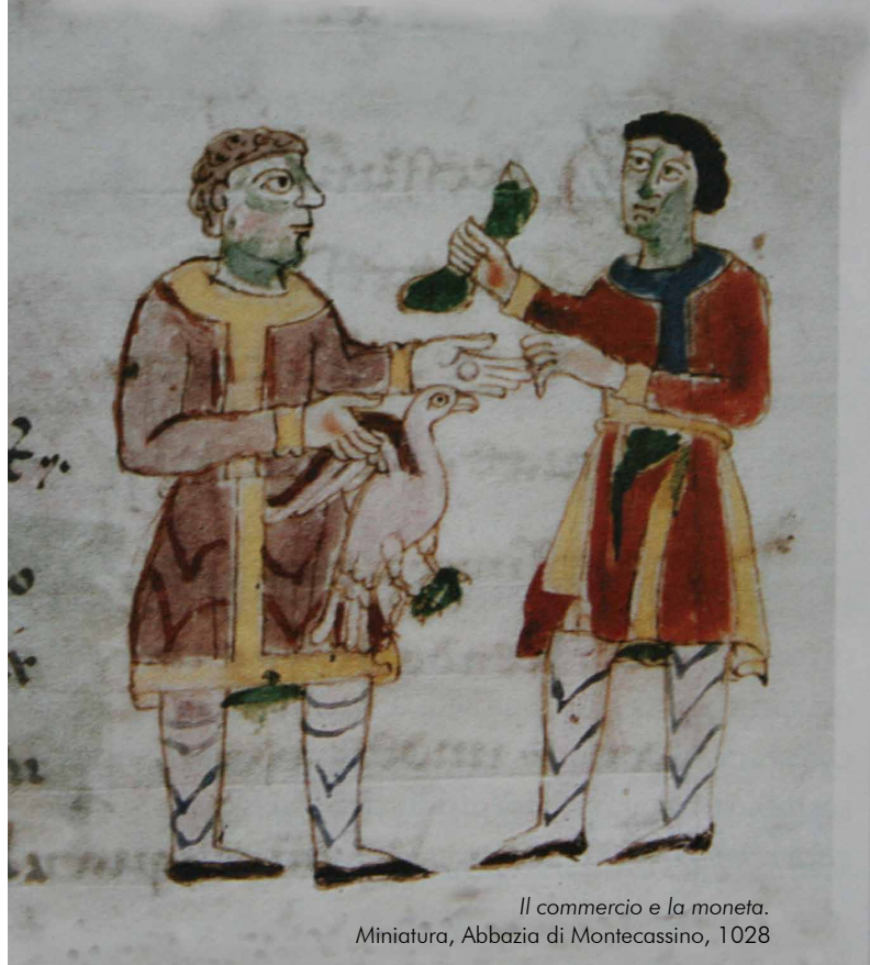
Il commercio e la moneta. Miniatura, Abbazia di Montecassino, 1028